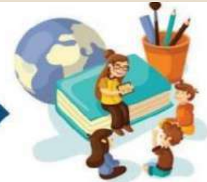
Mengajar di Satuan Pendidikan

Mahasiswa datang ke satuan pendidikan dan melakukan kolaborasi terkait dengan program-program yang akan diselenggarakan selama di satuan pendidikan.