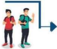
Mahasiswa mendaftar Mata Kuliah di KRS