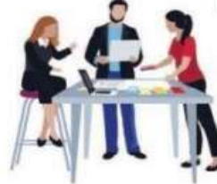
Kolaborasi dengan Satuan Pendidikan

Sebelum diberangkatkan ke satuan pendidikan, mahasiswa diberikan pembekalan oleh dosen dari PT masing-masing. Pembekalan dilakukan untuk mempersiapkan rencana kegiatan yang akan dilaksanakan saat di satuan pendidikan.